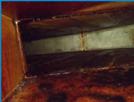
» Verschmutzter Kanal wie es auch bei Ihnen vorliegen kann. «

» Einhaltung der gesetzlichen Richtlinien «