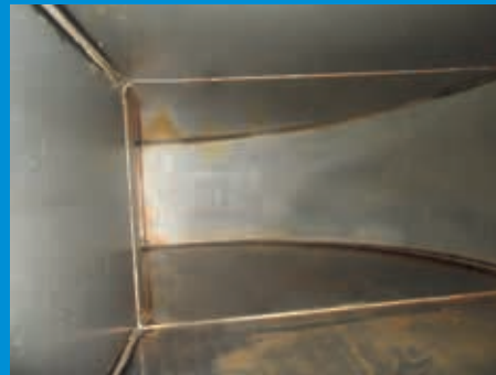
» Gereinigter Kanal nach fachgerechter Behandlung durch unser Unternehmen. «